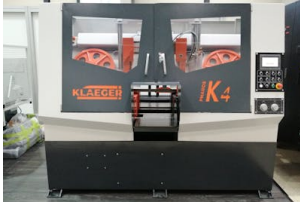
Säge Klaeger, Pharos K4