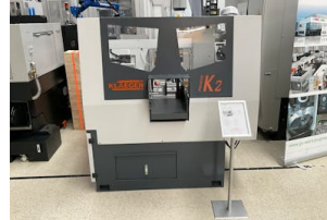
Säge Klaeger, Pharos K2